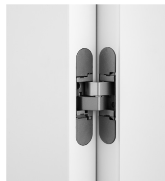
b. cerniera a scomparsa