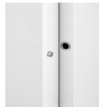
c. rostro centrale