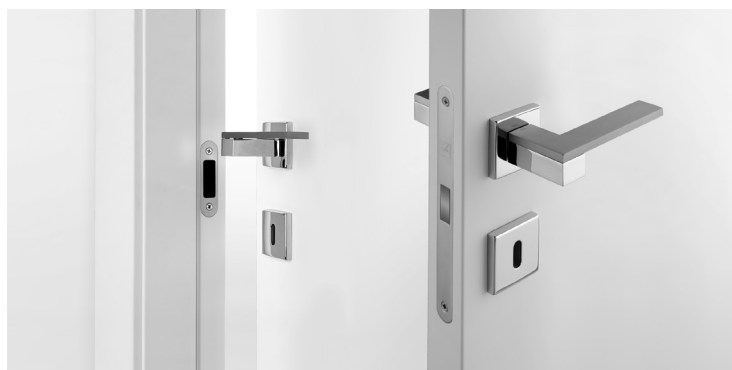
a. serratura magnetica

La FERRAMENTA è interamente MADE IN ITALY. Sul modello TESLA sono installate di serie una serratura MAGNETICA (a) , due cerniere a scomparsa (b) e rostro centrale (c) per garantire una maggiore stabilità della porta e conservarla nel tempo. La ferramenta può essere fornita nella finitura Cromo Opaco (DI SERIE) e Cromo Lucido.