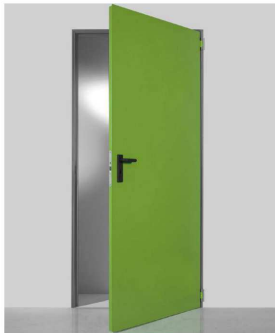
Porta ad un'anta