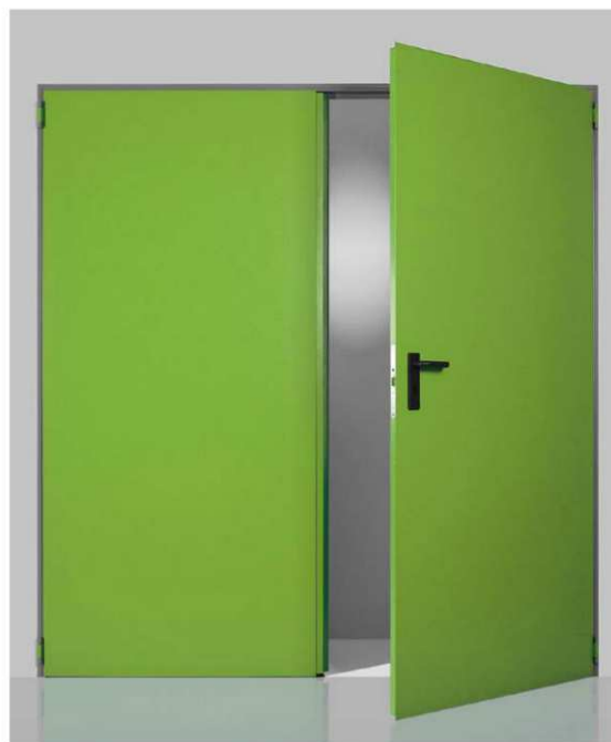
Porta a due ante

*escluso in combinazione con vari Optional